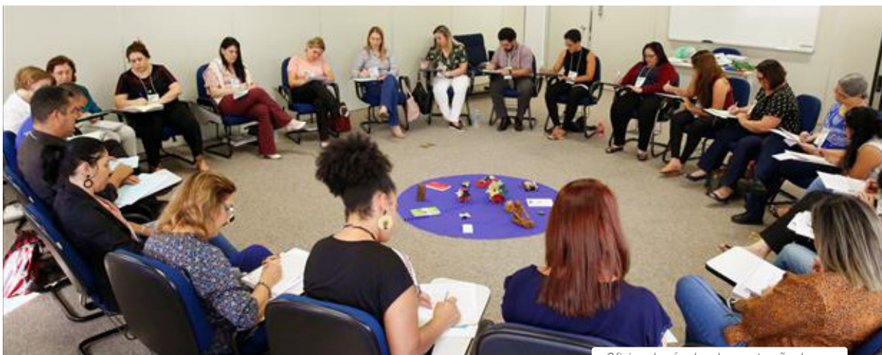
Oficina de círculos de construção de paz