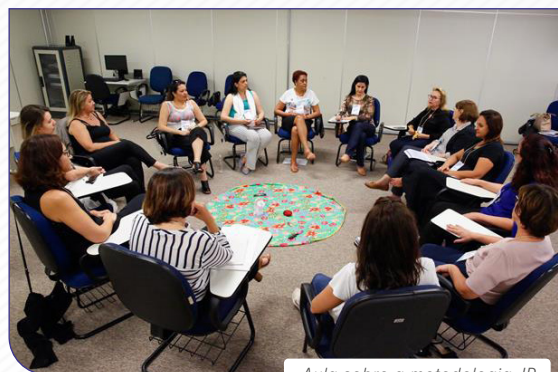
Aula sobre a metodologia JR

Atualmente, o Serviço de Justiça Restaurativa conta com assistentes sociais, psicólogos e servidores